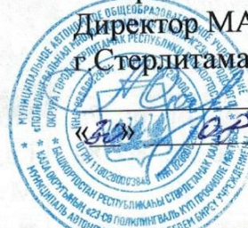
График посещения родителями (законными представителями) обучающихся МАОУ «ПМШ №23» г. Стерлитамак РБ в школьной столовой на 2024-2025 учебный год